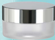
キャップ:シルバーピカ(金冠) ジャー:クリアマット塗装