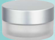
キャップ:マットシルバー(金冠) ジャー:クリアマット塗装