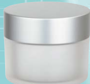
キャップ:マットシルバー(金冠) ジャー:クリアマット塗装