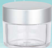
キャップ:マットシルバー(金冠) ジャー:透明