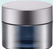
キャップ:マットシルバー(金冠) ジャー:シルバーハーフ蒸着