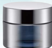
キャップ:シルバーピカ(金冠) ジャー:シルバーハーフ蒸着