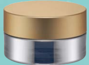
キャップ:マットゴールド(金冠) ジャー:シルバーハーフ蒸着