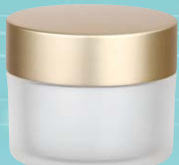
キャップ:マットゴールド(金冠) ジャー:クリアマット塗装