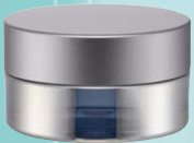
キャップ:マットシルバー(金冠) ジャー:シルバーハーフ蒸着