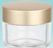
キャップ:マットゴールド(金冠) ジャー:透明