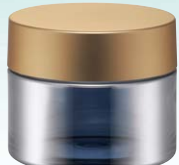
キャップ:マットゴールド(金冠) ジャー:シルバーハーフ蒸着