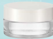
キャップ:白(樹脂) ジャー:透明