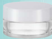
キャップ:乳白(樹脂) ジャー:透明