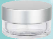
キャップ:マットシルバー(金冠) ジャー:透明