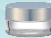
キャップ:ドルチェホワイト(樹脂) ジャー:透明