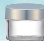
キャップ:ドルチェホワイト(樹脂) ジャー:透明