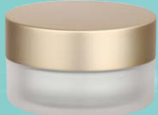
キャップ:マットゴールド(金冠) ジャー:クリアマット塗装