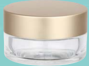
キャップ:マットゴールド(金冠) ジャー:透明