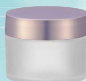
キャップ:ドルチェライトマゼンダ(樹脂) ジャー:クリアマット塗装