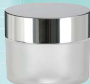
キャップ:シルバーピカ(金冠) ジャー:クリアマット塗装