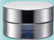
キャップ:シルバーピカ(金冠) ジャー:シルバーハーフ蒸着