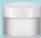
キャップ:乳白(樹脂) ジャー:クリアマット塗装