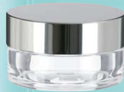
キャップ:シルバーピカ(金冠) ジャー:透明