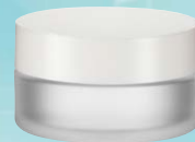
キャップ:白(樹脂) ジャー:クリアマット塗装