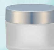
キャップ:ドルチェホワイト(樹脂) ジャー:クリアマット塗装