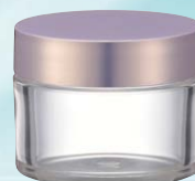
キャップ:ドルチェライトマゼンダ(樹脂) ジャー:透明