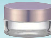
キャップ:ドルチェライトマゼンダ(樹脂) ジャー:透明