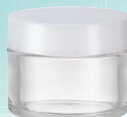
キャップ:乳白(樹脂) ジャー:透明