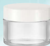
キャップ:白(樹脂) ジャー:透明