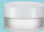
キャップ:乳白(樹脂) ジャー:クリアマット塗装