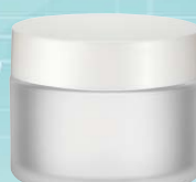
キャップ:白(樹脂) ジャー:クリアマット塗装