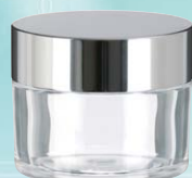
キャップ:シルバーピカ(金冠) ジャー:透明