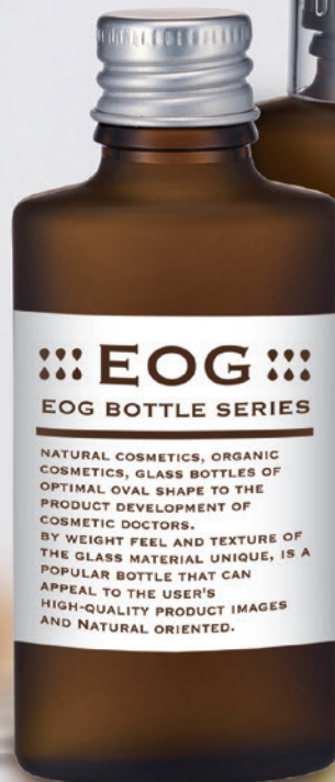
EOG-30(フロスト瓶) 共通アルミCAP(無地)