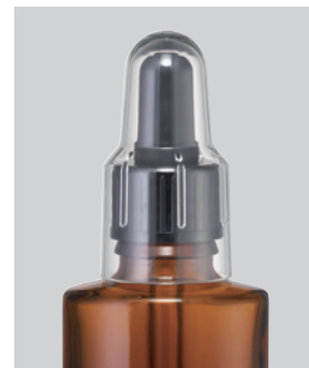
共通スポイト82mm×7.0φ(黒)・オーバーCAPNo.1(ナチュラル)