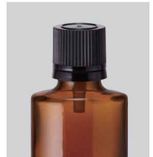
新中栓付CAPNo.2(黒)ドロップ栓