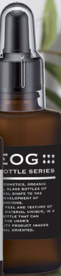
EOG-30(フロスト瓶) 共通スボイト 82mm×70φ(黒) オーバーCAPNo.1(ナチュラル)