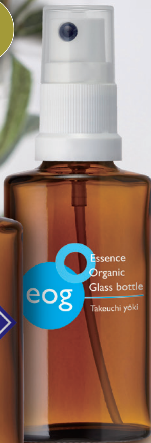
EOG-30(スキ瓶) ファイファ21570 ミストスプレー(白)CAP付