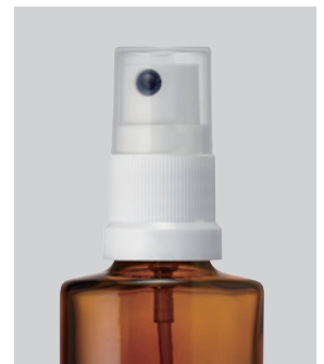
ファイファ21570ミストスプレー(白)CAP付