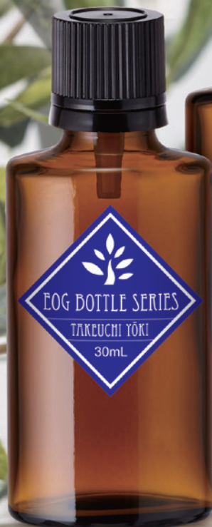
EOG-30(スキ瓶) 新中栓付CAP No.2(黒)ドロップ栓